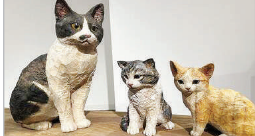
هنر مجسمه‌سازی با چوب - ژاپن