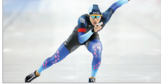
مسابقات اسکیت سرعت - ژاپن