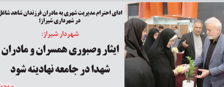
ادای احترام مدیریت شهری به مادران فرزندان شاهد شاعل در شهرداری شیراز؛ شهردار شیراز: ایثار و صبوری همسران و مادران شهدا در جامعه نهادینه شود

کارگروه سامان‌دهی نمایشگاه‌های اتومبیل به همت شهرداری منطقه شش شیراز با حضور نماینده دادستانی، جانشین پلیس راهور، رئیس اداره کل پیشگیری و رفع تخلفات شهری شهرداری، نماینده نمایشگاه‌داران اتومبیل و جمعی از مسئولان شهری