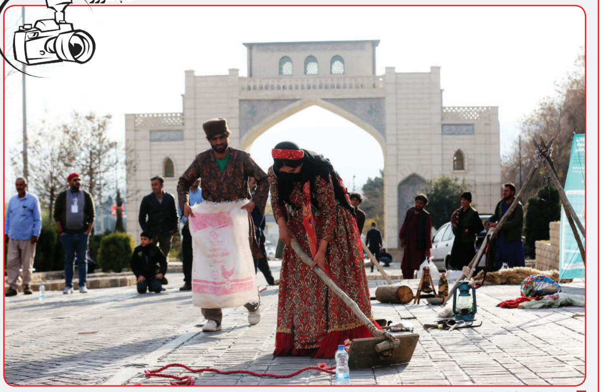
جشنواره تئاتر منطقه‌ای «پارس» - شیراز