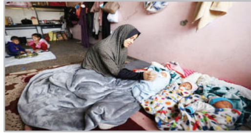
ارنوک‌ها آوارگان جنگ در دبیرالبلخ - نوار غزه