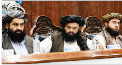
نشست خبری هدایتا... بدری، رئیس بانک افغانستان - کابل