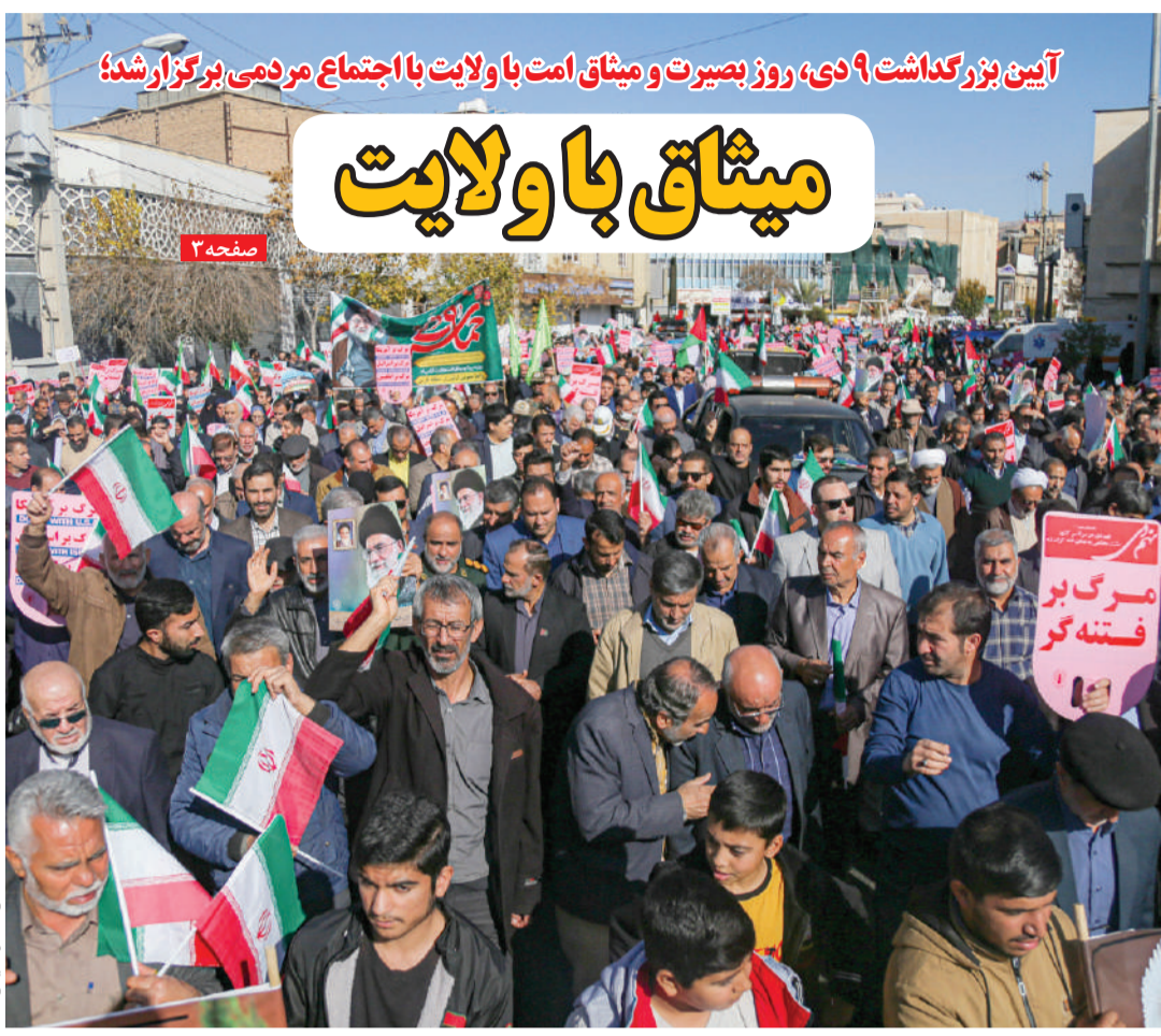
آیین بزرگداشت ۹ دی، روز بصیرت و میثاق است با ولایت با اجتماع مردمی برگزار شد؛ میثاق با ولایت

امروز موضوع سوءمدیریت در کشور به کلیه واژه‌های تبدیل شده است که رد آن را می‌توان در هر مشکلی پیگیری کرد و یافت. علی‌رغم اینکه کشور در شرایط تحریم قرار گرفته است و به نظر می‌رسد کمبود منابع مالی مشکل اساسی و اصلی کشور باشد، اما همچنان سوءمدیریت با اختلاف جایگاه نخست مسئله کشور را به خود اختصاص داده است. در دهه‌های اخیر یکی از دلایل مشکلات و کاستی‌ها در تقریباً تمام حوزه‌های کشور از اقتصاد تا فرهنگ و از ورزش تا بهداشت و ... سوءمدیریت عنوان شده است. اگر نظارتی بر قیمت کالاها نیست یا قیمت ارز در نوسان است به سوءمدیریت نسبت داده می‌شود. اگر با قطعی مکرر برق مواجه می‌شویم ناشی از سوءمدیریت می‌شود. اگر باشگاه‌های ورزشی با تیم‌های ملی مشکلات متعدد روبرو می‌شوند ناشی از سوءمدیریت است و خلاصه اکثر مشکلات کشور به دلیل همین سوءمدیریت است. رئیس مجلس شورای اسلامی در تازه‌ترین سخنرانی خود نیز با بیان اینکه آنچه ما اکنون در کشور از آن رنج می‌بریم، چالش مدیریتی در سطوح مختلف و عدم ثبات در تصمیم‌گیری‌ها است و این دو موضوع همه ما را اذیت می‌کند، اما این اولین بار نبود و آخرین بار نیز نخواهد بود که زبان حال مدیریت و وضعیت آن را از زبان مدیران رده بالا می‌شنویم. آنچه با عنوان مدیریت در ایران شاهد هستیم، مجموعه‌ای از روش‌های مبتنی بر تضاد، آزمون و خطا و اعمال خودسرانه است که هیچ پشتوانه نظری و حرفه‌ای ندارد. تمام این‌ها برداشته‌های تجربی مدیران هستند که با آن پیش می‌روند. اینگونه عمل کردن مدیریت نیست و مبنای تمام آن‌ها تضاد است شاید وجود افرادی هر روز با مسائل اجتماعی سر و کار دارند این توهم در آن‌ها ایجاد کرده است که همه چیز را می‌دانند و می‌توانند گره کور این مشکل را بگشایند.